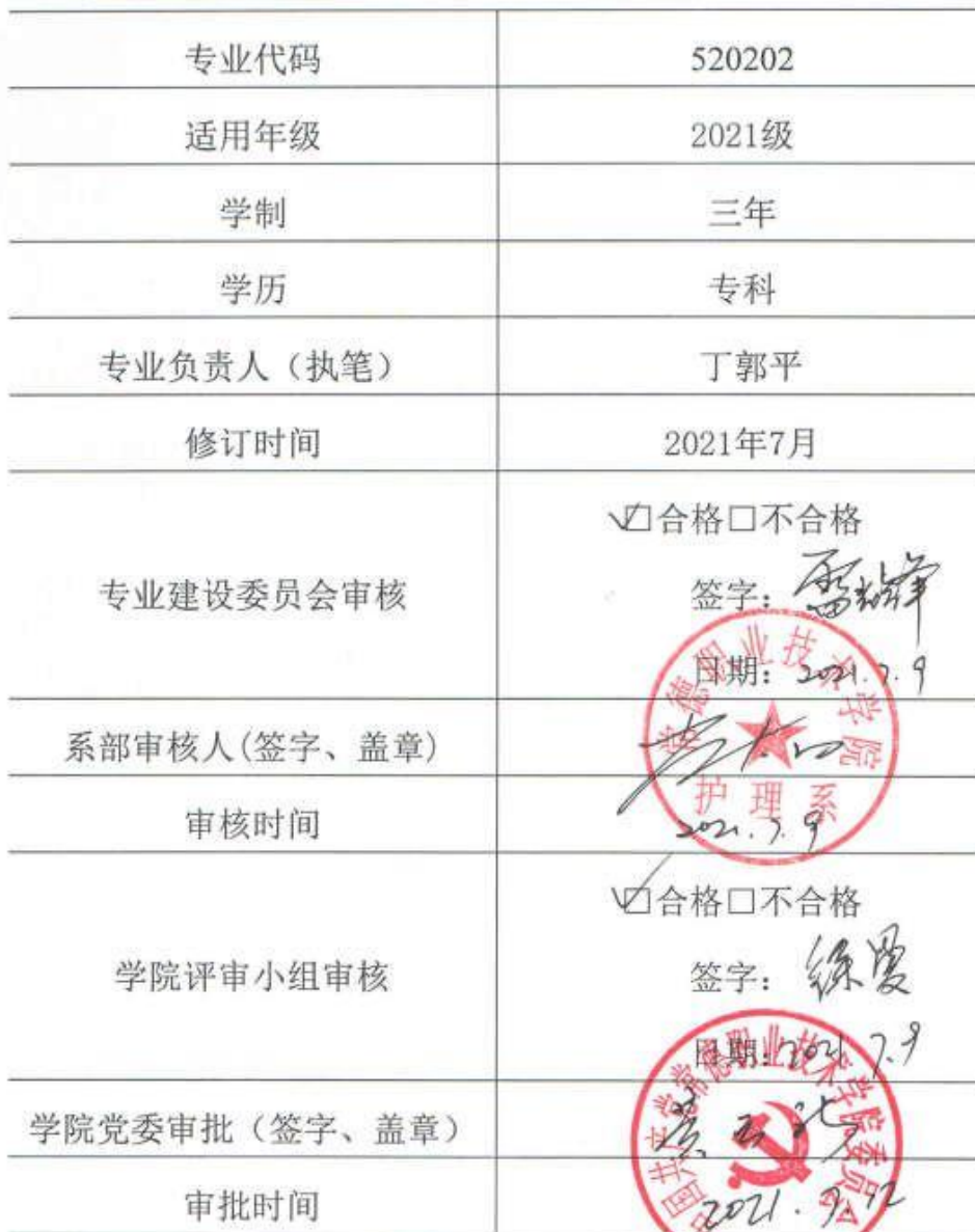
2021 级 助产 专业人才培养方案审批信息表

说明：本人才培养方案适用于统招、单招三年制大专。对退役军人、下岗职工、农民工、新型职业农民单独制定人才培养方案。校企合作班级在国家教学标准基础上可以增加企业特色课程，人才培养方案单独制定。