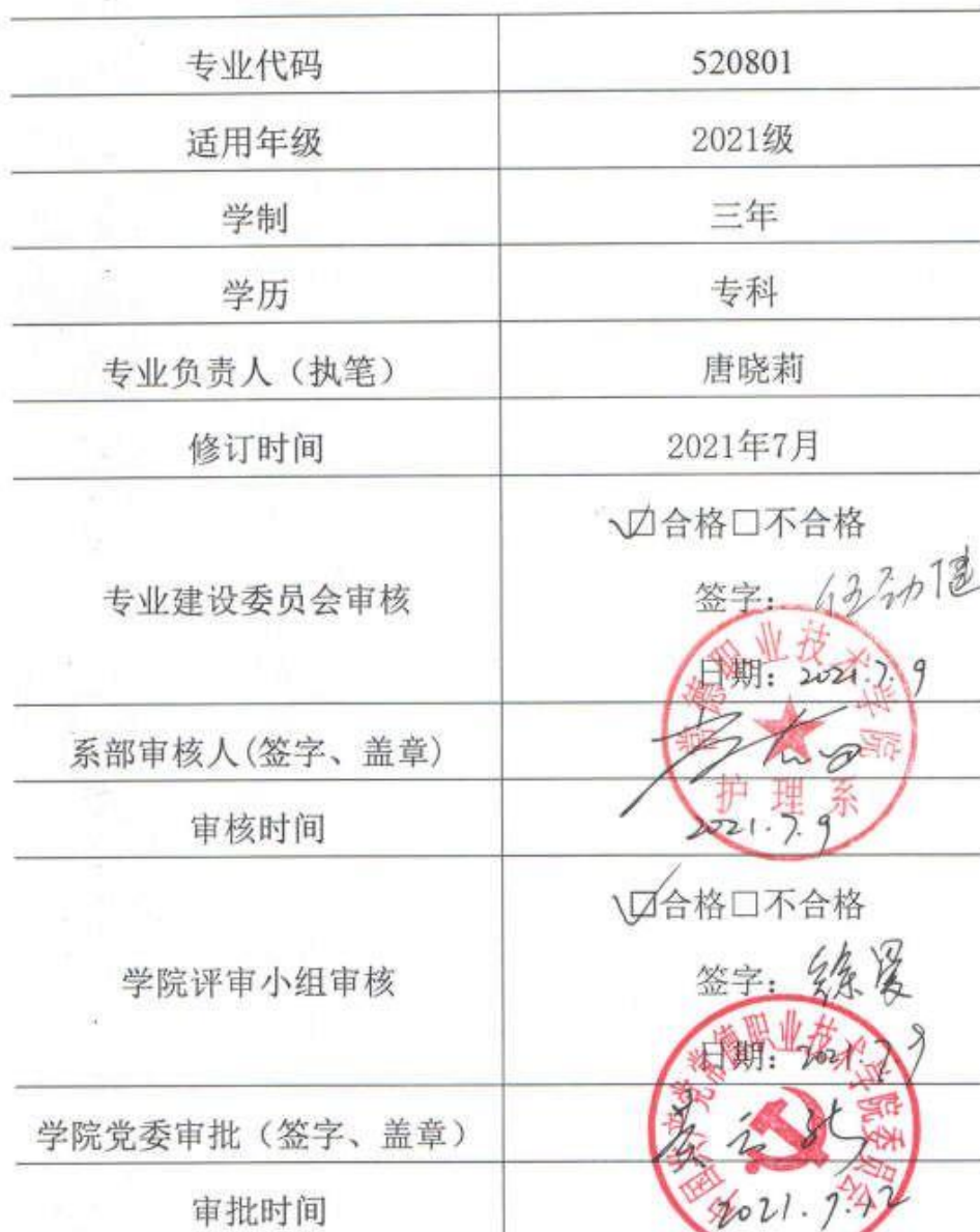
2021 级 健康管理 专业人才培养方案审批信息表

说明:本人才培养方案适用于统招、单招三年制大专。对退役军人、下岗职工、农民工、新型职业农民单独制定人才培养方案。校企合作班级在国家教学标准基础上可以增加企业特色课程,人才培养方案单独制定。