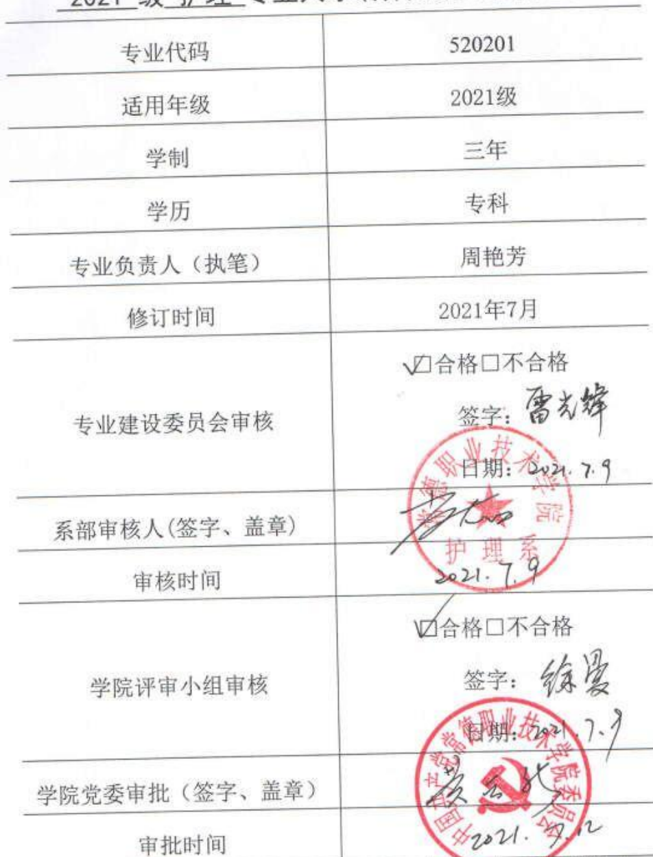
2021 级 护理 专业人才培养方案审批信息表

说明: 本人才培养方案适用于统招、单招三年制大专。对退役军人、下岗职工、农民工、新型职业农民单独制定人才培养方案。校企合作班级在国家教学标准基础上可以增加企业特色课程, 人才培养方案单独制定。